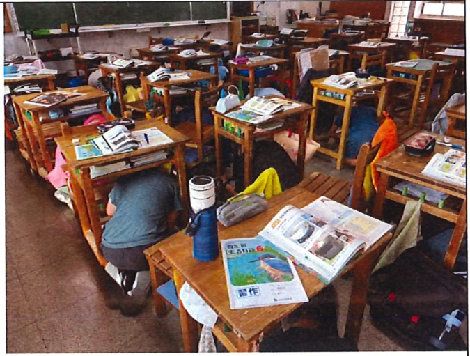
地點：忠義國小教室 時間：111.09.21 說明：班級學生聽聞警報聲，立即「趴下、掩護、穩住」