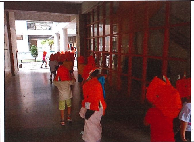
地點：忠義國小走廊 時間：111.09.21 說明：第一階段避難結束，學生於疏散動線進行演練