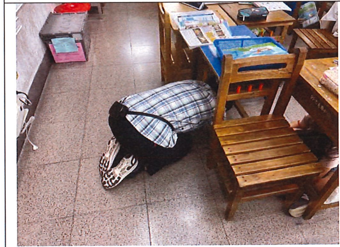
地點：忠義國小教室 時間：111.09.21 說明：授課教師聽聞警報聲，立即「趴下、掩護、穩住」