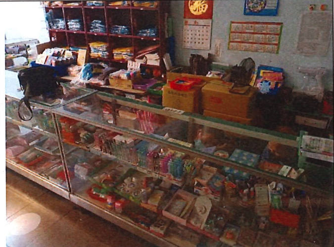
地點：忠義國小合作社 時間：111.09.21 說明：合作社員工聽聞警報聲，立即「趴下、掩護、穩住」