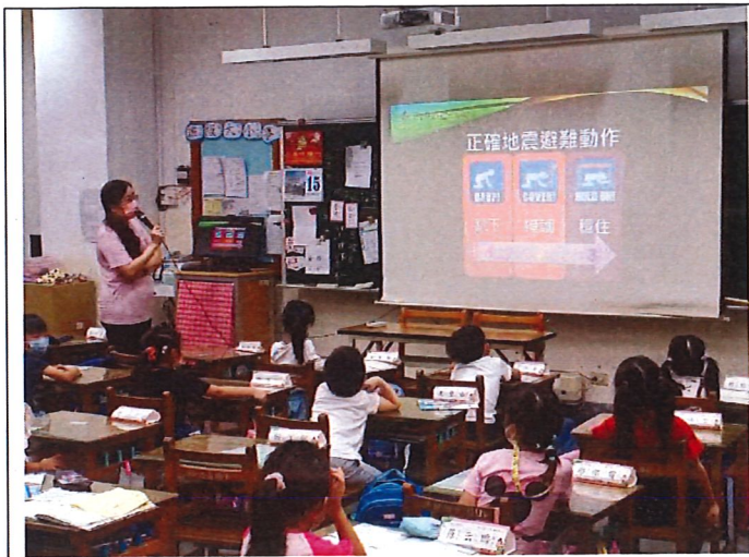
地點：忠義國小教室 時間：111.09.15 說明：防災預演結束，全校導師於班級內進行防災教育宣導