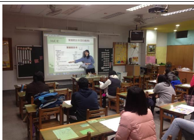
導師利用家長日向家長說明家庭防災卡內容