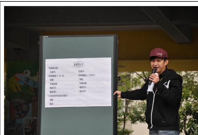
兒童朝會向全校同學說明填寫家庭防災卡的方法