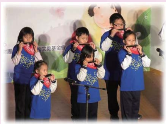
悅耳的陶笛聲，都是辛勤練習的成果。

為響應「Bookstart閱讀起步走」的精神，希望將閱讀扎根工作全面性普及至新北市每一個角落，今年贈送給小一新生的書籍涵括親情、情緒管理、環保、人格特質等多個類別的優質兒童繪本，希望父母及長者多引導及陪伴孩子養成閱讀習慣，共同推動閱讀教育。