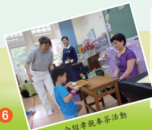
介紹孝親奉茶活動