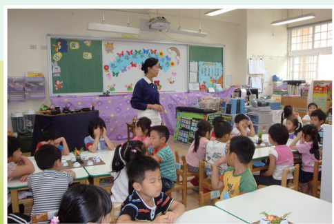
感謝父母恩奉茶活動