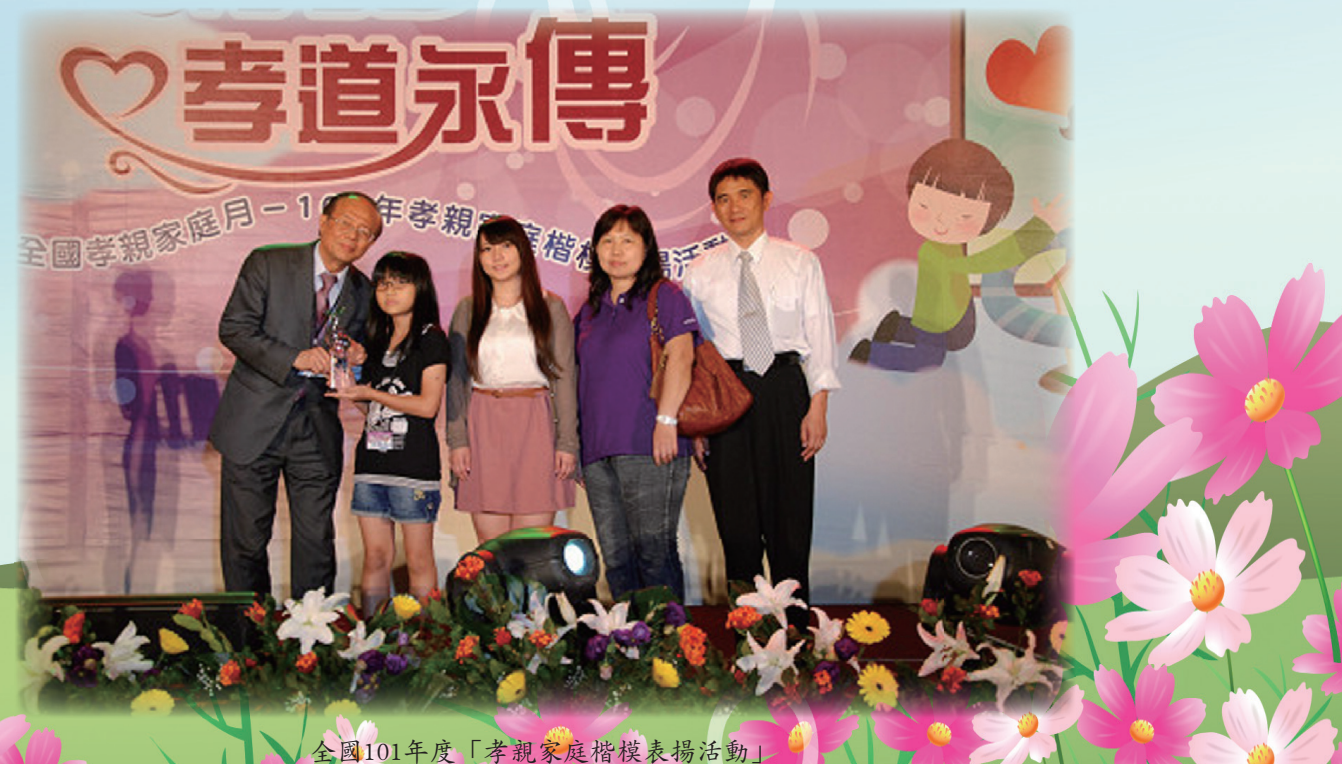
全國101年度「孝親家庭楷模表揚活動」

為人父母者期盼孩子盡人子之孝，是天經地義的事，然而社會畢竟改變了，沒有那麼多的框架來限制、規範行為，父母能有智慧的教育子女，用心經營「親子關係」，「孝道」必然會以更自在、更富於人性的方式存在。