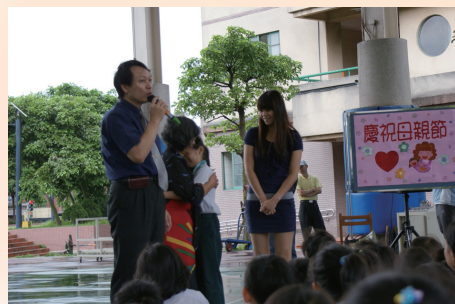
擁抱奶奶感謝母親

「親」拆解文字部件可解釋為「辛苦看得見」，「孝親」則是因為看見親長的辛苦，而發自內心的敬愛順從親長。因此，讓孩子參與家務勞動就是實踐孝親的第一步，參與的過程，孩子不但體會了辛苦、學會了珍惜，更了解身為家庭一份子應盡的責任。再則，父母親對待親長的態度，對子女來說就是潛移默化的身教和言教。孩子從實作和學習中，確定自己在家庭中扮演的角色，把孝親行塑成一種生活態度、生活習慣。