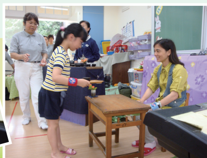
進行奉茶感恩活動