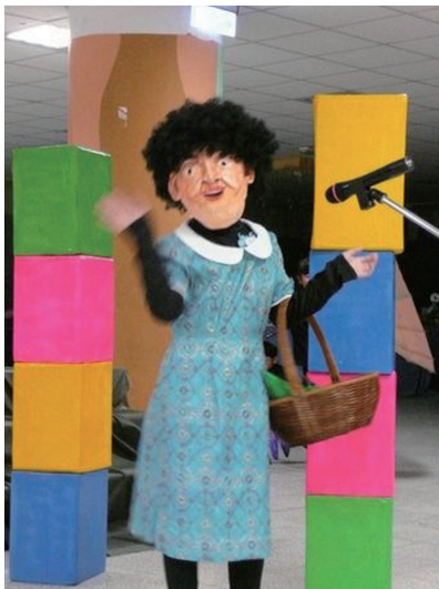
葫蘆墩國小—尋找外婆的小紅帽彼得

「樹欲靜而風不止，子欲養而親不在」，在成長和逐夢中，我們常常對待朋友或同事非常親切，但往往對生命中最關心自己、最親密的家人最冷漠和殘酷！讓我們重新學習分享、讚美、支持、體諒、關心、包容、接納、分擔與行動，讓愛凝聚家人關係與家庭韌性，發揮家庭的價值與意義。