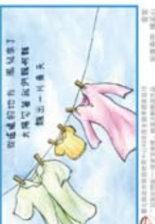
臺北縣立家庭教育中心99年度孝親月家庭月 「我愛妙想家」— 一般家庭組, 繪畫及創作類作品 The Moment of joy 福和國中 林麗華