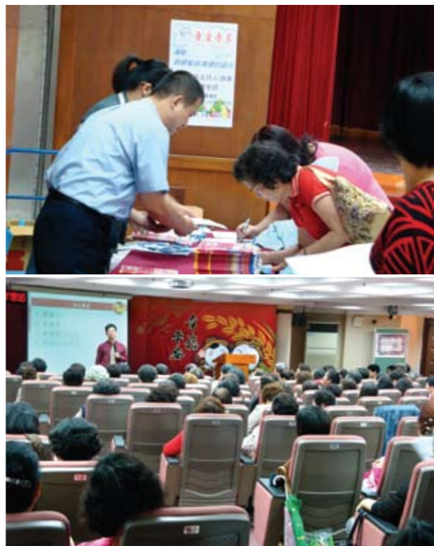
圖 = 公民營講座

3-6月家庭教育中心淡水志工於淡水區學校進行6場家庭戲劇巡迴表演，將家庭相關意涵融入家庭戲劇之中，透過劇中角色呈現親子間的互動、家庭成員間的溝通等情景，以增進民眾經營家庭生活的知能。