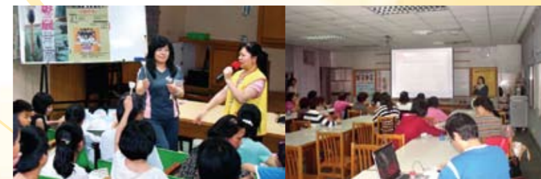
圖=漳和國中電影導讀

尼、十七歲的天空、聽見·幸福的呼喚、爸爸，回家吧！。為了讓出席的觀眾能更快地掌握電影內涵，在電影播映之前，電影導讀帶領人針對電影進行介紹與分享；電影播放時，透過電影劇情敘事，提供觀眾關於家庭生活教育及婚姻教育的意義；會後影片帶領人引導觀眾參與討論、反思與交流，或以講座、融入課程等多元方式進行。部分學校針對小朋友另外還提供學習單，以提昇教育的效果。詳細播放時間及地點請上臺北縣政府家庭教育中心網址 http://www.family.tpc.gov.tw 「活動報導」項下查詢。