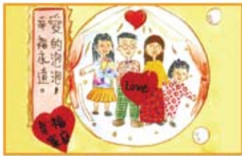
臺北縣立家庭教育中心99年度孝親月家庭月 「我愛妙想家」— 一般家庭組, 繪畫及創作類作品 The Moment of joy 福和國中 林麗華