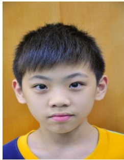
設計者 508 黃鉉喹