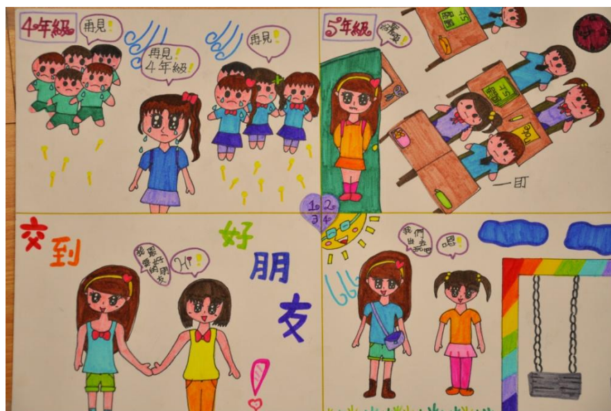
佳作 511 莊勻禔