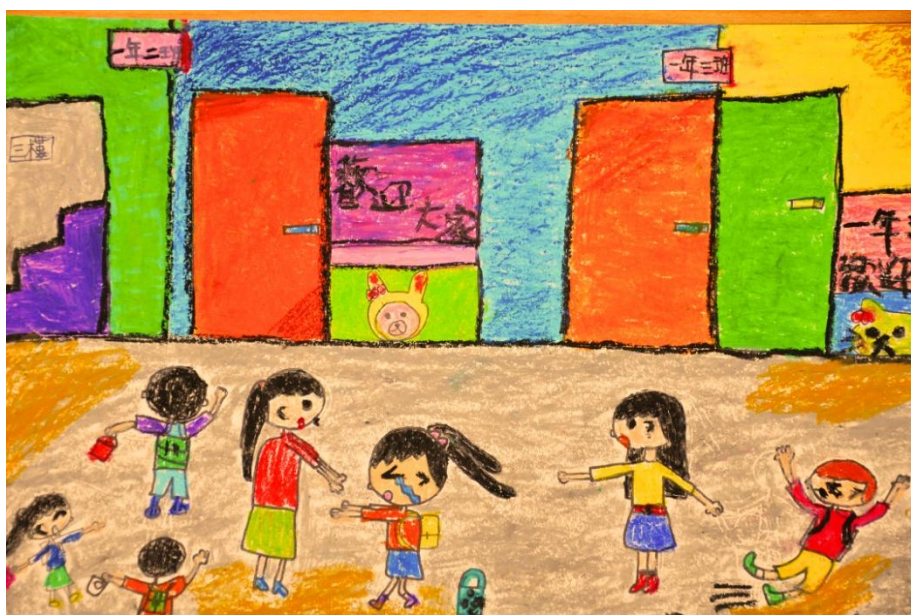
入選作品 512 孟新莞

也可以由孩子來當嚮導，請孩子告訴你，每天下課他都到哪兒玩耍？他跟好朋友的秘密基地在哪兒？孩子愈早融入新環境，才能降低分離焦慮。