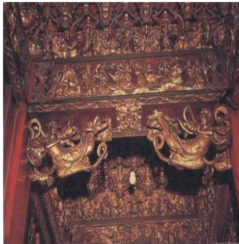
R 飛天樂伎雀替裝飾